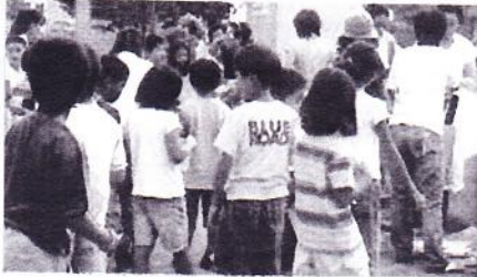
賞をもらう子供達

広袴子ども会では毎年夏休みにラジオ体操をおこなっています。今年も計9日間実施されました。毎日90人を越える子供達が参加して、朝から元気よく爽