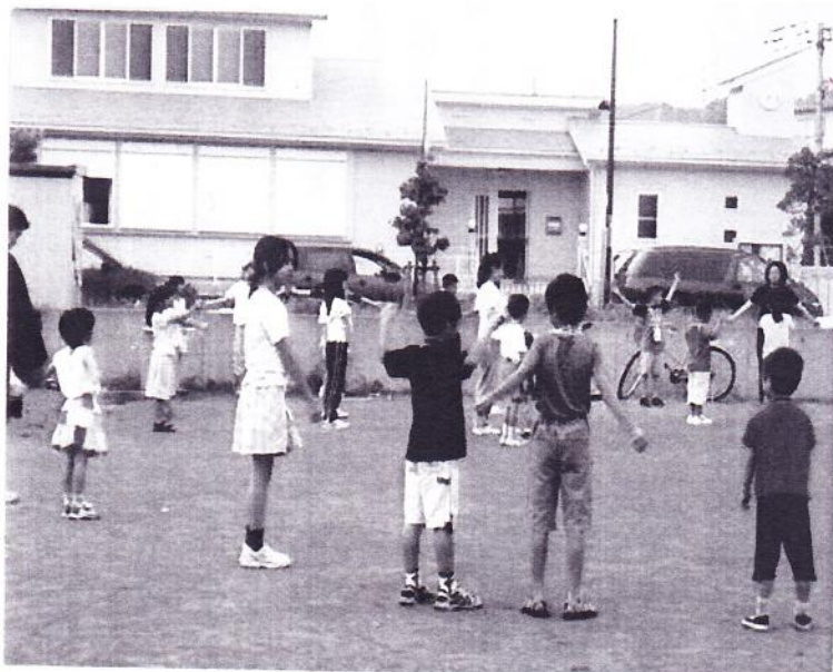
ラジオ体操をする子供達

月31日夏休み最後の日、朝6時25分に子供達が続々と集まってきました。友達を見つ