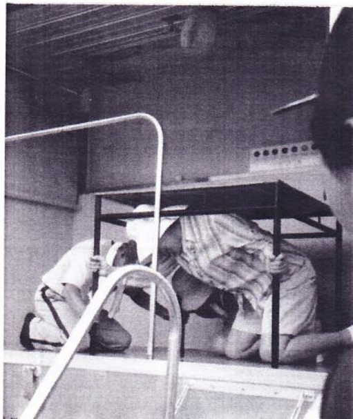
「ぐらり号」で地震体験

をもとに来年はAEDの訓練と他の訓練との時間的バランスを考えたいと述べられています。市の防災課、鶴川消防出張所から多くの参加者のあったこともお褒めをいただいています。（信定）