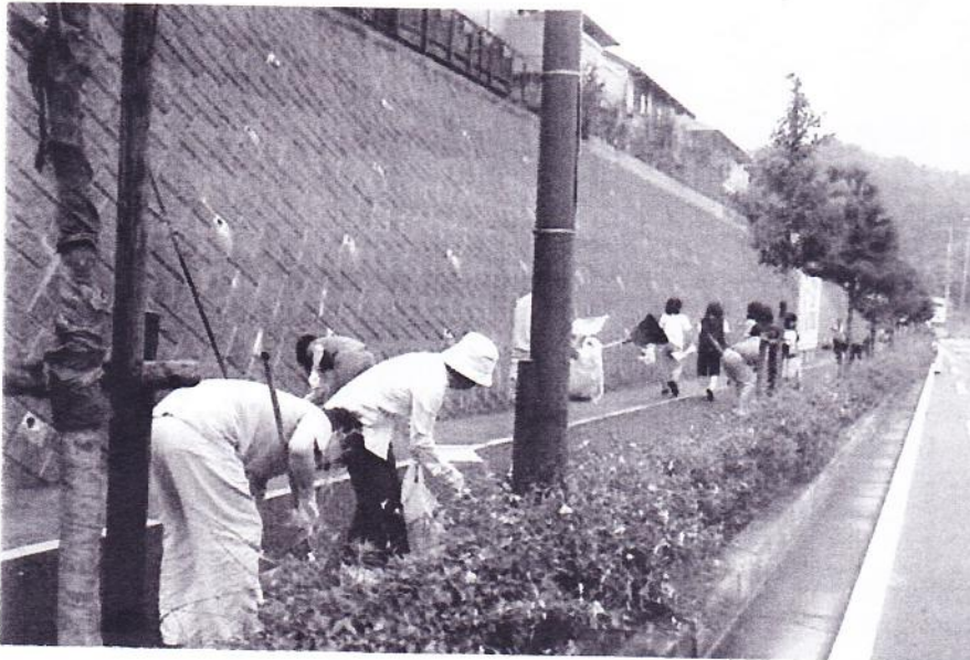
歩道も植え込みも