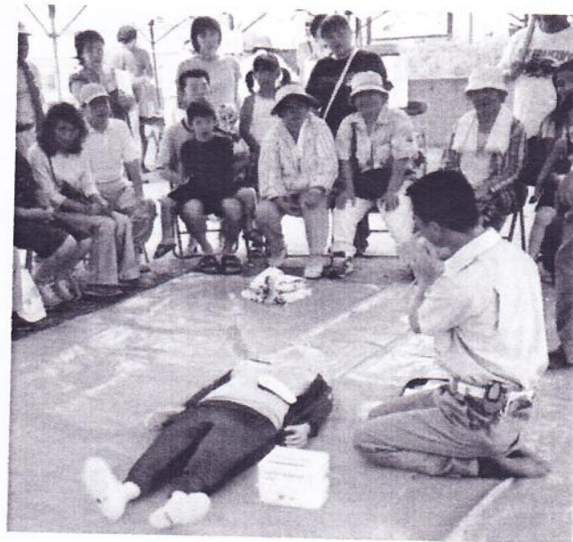
応急手当とAEDの使い方を・・