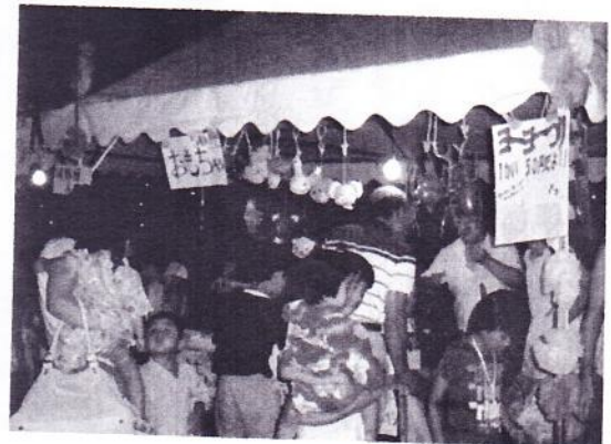
子供達に大人気の出店

とはいえ、今年は浴衣姿の若い人達、特に子供達の多さが目立っていたように思います。将来、広袴を背負ってたつであらう彼らの心の中に、広袴の夏のページとして記憶に残るイベントに定着してきたと実感しています。(内村)