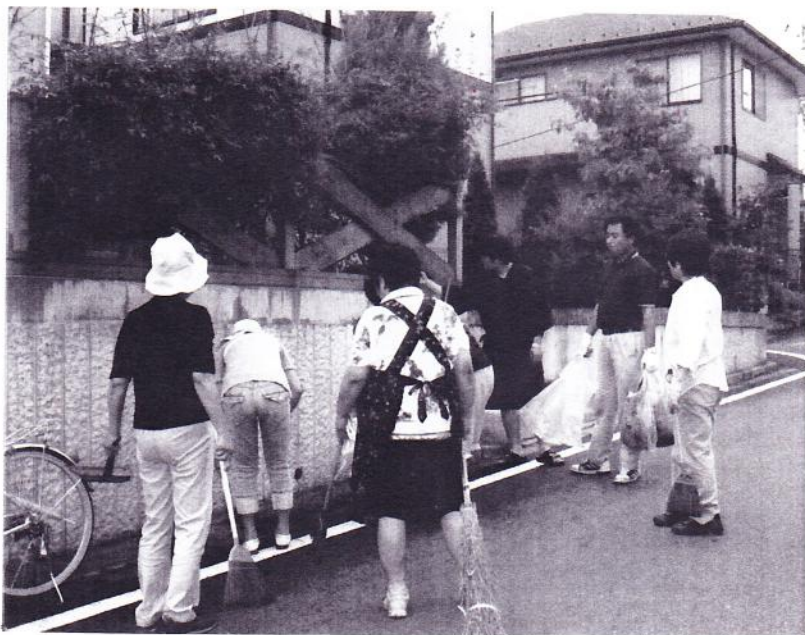
コミュニケーションを図りながら..

この日はきれいにすると共に、近隣の皆さんとのコミュニケーションの場になりました。また街を美化する事で防犯