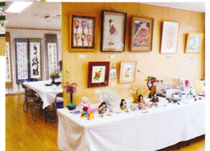
書道と手芸コーナー