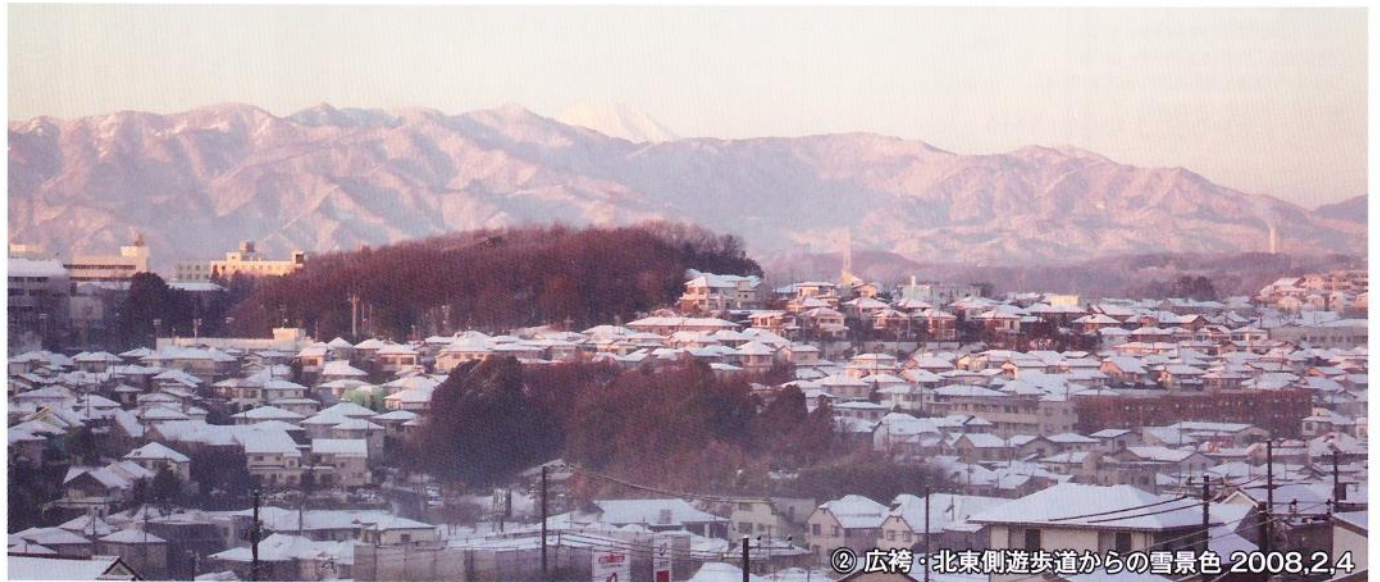
② 広袴・北東側遊歩道からの雪景色 2008,2,4