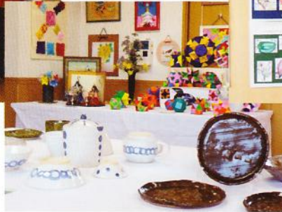
陶芸と折り紙コーナー