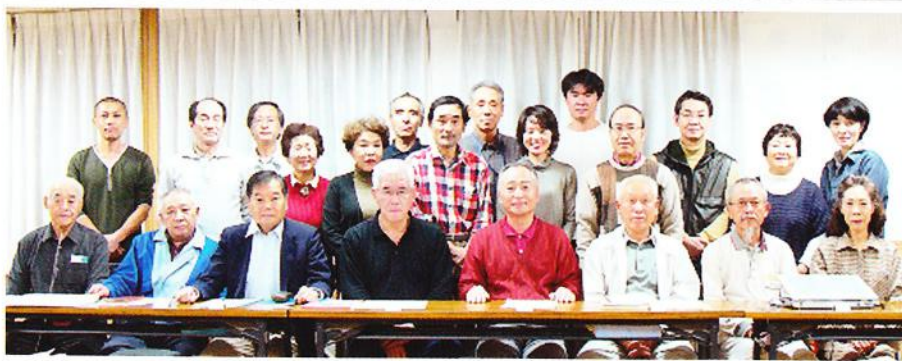
広袴町内会 役員一同

最後に、今年広袴町内会としても災害に対する備えをしっかりとやらなければならぬ年と考えておりますので、皆さんのご協力をお願い致します。