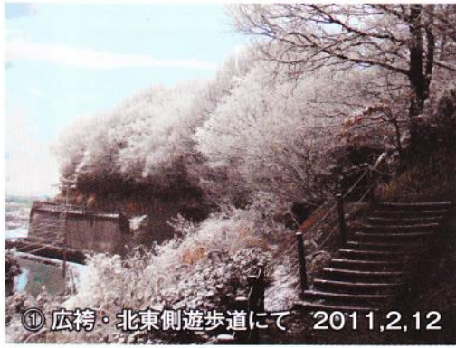
① 広袴・北東側遊歩道にて 2011,2,12