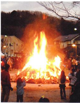
火柱が高くメラメラと