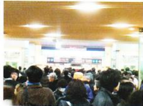
小田急改札口の状況

高層階から階段でやっとの思いで外に出て、小田急の改札に向かいましたが、改札は閉鎖され人だかりで混乱していました。しかし、皆列を乱さず