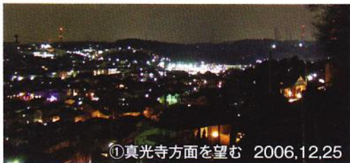
①真光寺方面を望む 2006,12,25

しかし、眺望の良さを愛でてばかりでは進歩がないであろう。今回は、紙面をお借りして、筆者が広袴に引越して以来、