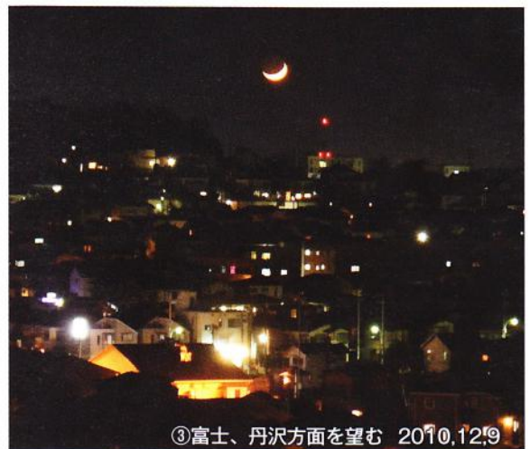
③富士、丹沢方面を望む 2010,12,9

それが夜道を歩くこととなれば、もうアドベンチャーである。もし、かつて遊歩道が作られた際に夜道を歩くことが想定されていなかったのなら、それは非文明的な話である。何故ならば、掲載した写