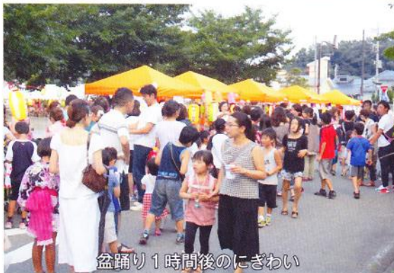
盆踊り1時間後のにぎわい