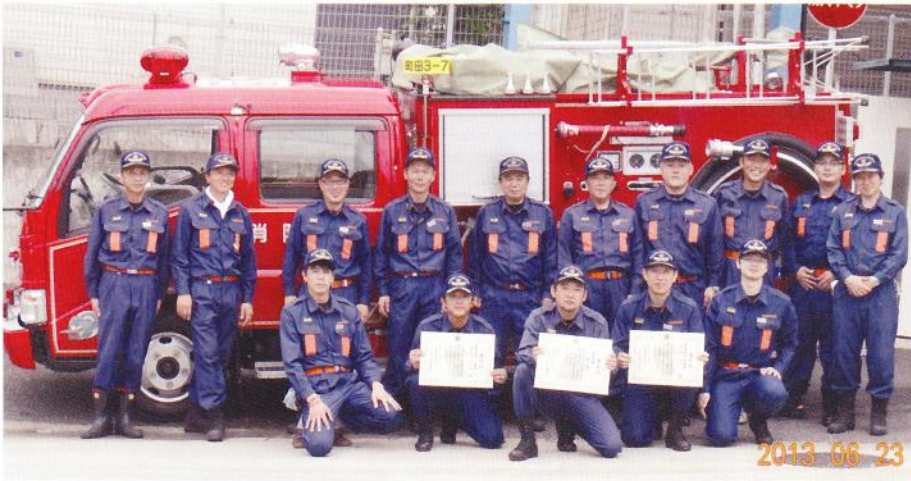
(第三分団第七部の皆様と消防車)

平成二十五年六月二十三日(日) 一二時よりリサイクル文化センター駐 車場にて 第二十六回町田市消防団第三分団消 防ポンプ操法大会準優勝！