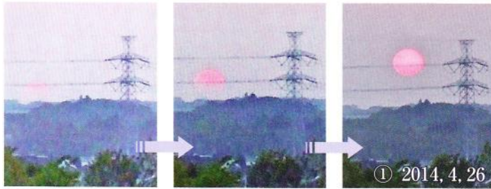
① 2014, 4, 26

二年前の六月、本会報の第三十号の時に「三丁目の夕日」を取り上げた。朝日の際には、できれば北東に面している反対側の二丁目の丘でと思っていた。しかし、広袴で最も東面の視界が開けているのは、神社方面に上っていく坂上の丘一帯である。そこには「鶴川台尾根緑地」の立札があり広袴三丁目所在と記されている。一帯は里山の風情が残り、多くの野鳥が飛来し、同時に朝日を堪能できる場所でもある。今