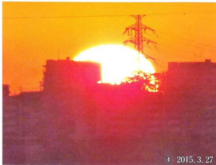
④ 2015, 3, 27

回の写真も、尾根道の中腹で撮った⑤を除き、全てこの丘での撮影である。朝日の観察で醍醐味の一つなのは、薄曇りの際に地平線上に微かに陽が浮かぶ瞬間を捉えることであらう。①の連続写真はその日の出の様子である。また、②のように息を飲むような朝焼けが観られた時は、あつという間に消え去るだけ