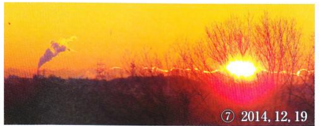
⑦ 2014, 12, 19

に、感激も一入となる。③は快晴の時の日の出の瞬間で、そのクローズアップしたものが④である。朝日は他の自然物等とも相性良く互いに引き立て合う。積雪の翌朝の⑤は、青白い景色と見事なコントラストを成している。花の時期には⑥のように花を照り輝かす役割を担う。⑦の樹林を通した朝日もまた風情がある。遠くの煙突からの煙が溶け合っ