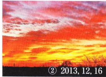
② 2013, 12, 16