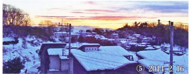
⑤ 2014, 2, 16

回の写真も、尾根道の中腹で撮った⑤を除き、全てこの丘での撮影である。朝日の観察で醍醐味の一つなのは、薄曇りの際に地平線上に微かに陽が浮かぶ瞬間を捉えることであらう。①の連続写真はその日の出の様子である。また、②のように息を飲むような朝焼けが観られた時は、あつという間に消え去るだけ