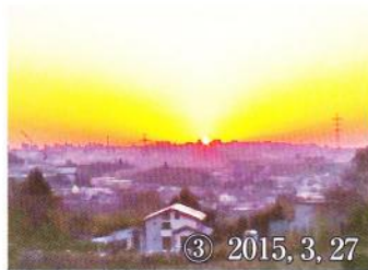
③ 2015, 3, 27