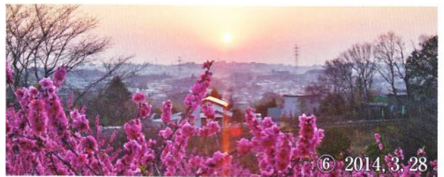
⑥ 2014, 3, 28