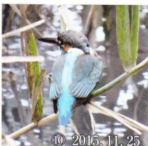
⑩ 2015, 11, 25