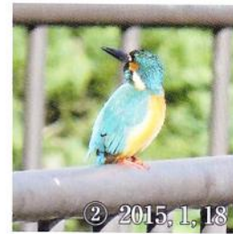
② 2015, 1, 18