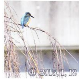
④ 2015, 1, 18