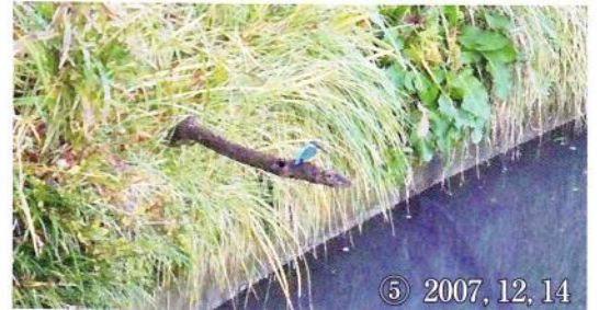
⑤ 2007, 12, 14