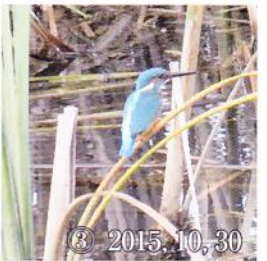
③ 2015, 10, 30