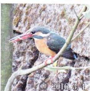
⑪ 2016, 3, 4

首を回せる。また、とても身軽で③のように池に繁茂しているガマの茎や④のシダレヤナギの枝などにも留まる。そして⑤の池の南西の川水が流れ込むエリアで特に出現する。一方、⑥は住宅や車道と隣り合わせで、しかも水量の少ないせせらぎ緑道だが、この川縁にも時々現れる。