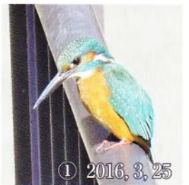
① 2016, 3, 25