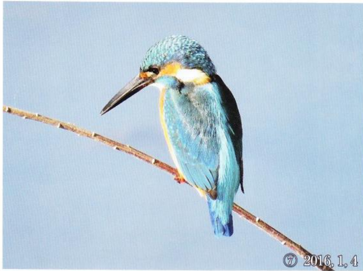
⑦ 2016, 1, 4