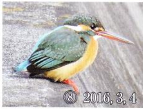
⑧ 2016, 3, 4